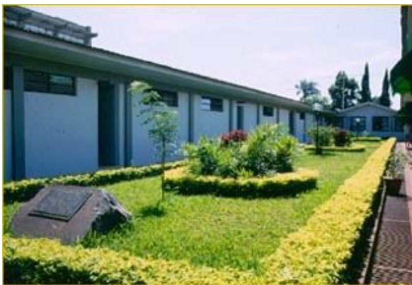
Figura 1. Campus de Marechal Cândido Rondon da Unioeste