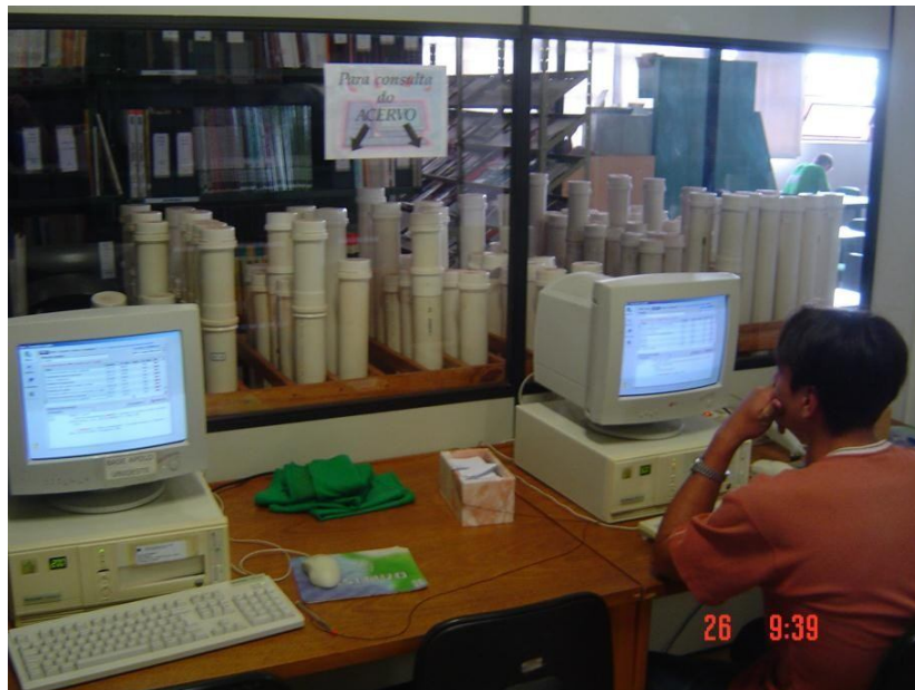
FIGURA 1. Consulta ao acervo