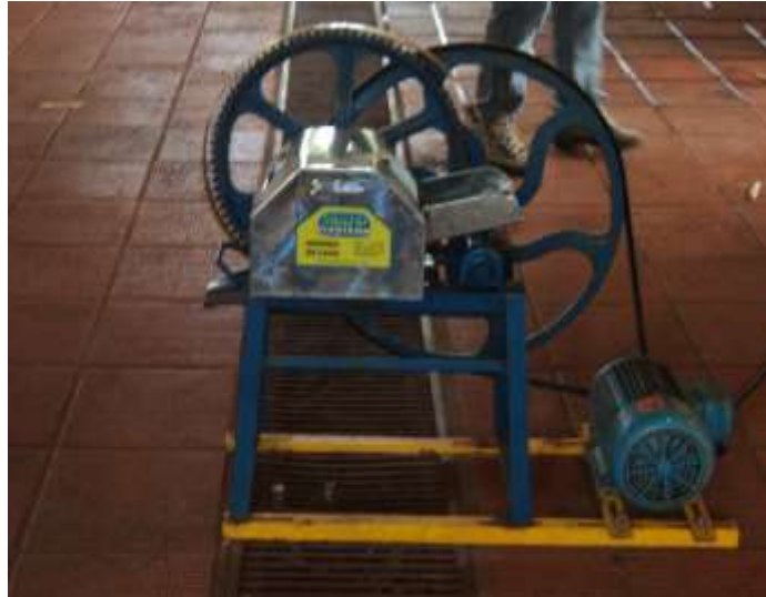
Figura 4- Moenda de cana com motor monofásico.