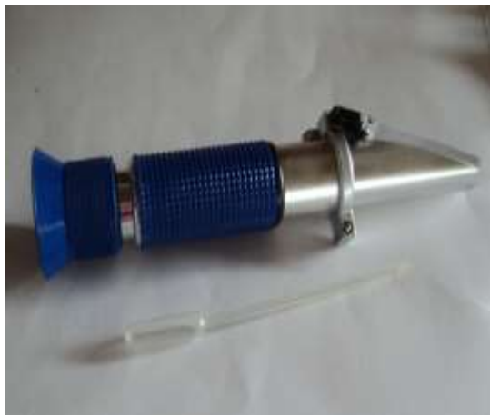
Figura 2 - Refratômetro de grau Brix de campo.

Durante o desenvolvimento da cultura foi medido o teor de sacarose nos colmo por meio do aparelho Refratômetro de campo (marca TOKYO modelo 032 – Figura 2) que fornece diretamente a porcentagem de sólidos solúveis do caldo