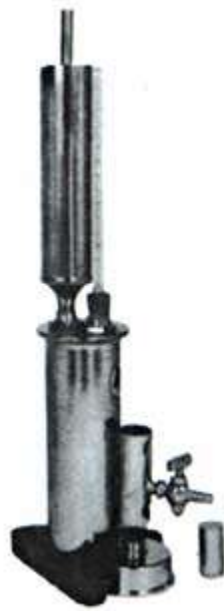
Figura 5- Ebuliômetro.